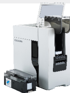
Modèle à double bac

DASCOTM Europe GmbH Heuweg 3 | 89079 Ulm | GERMANY Tel.: +49 731 2075-0 | Fax: +49 731 2075-100 info@dascom.com | www.dascomeurope.de